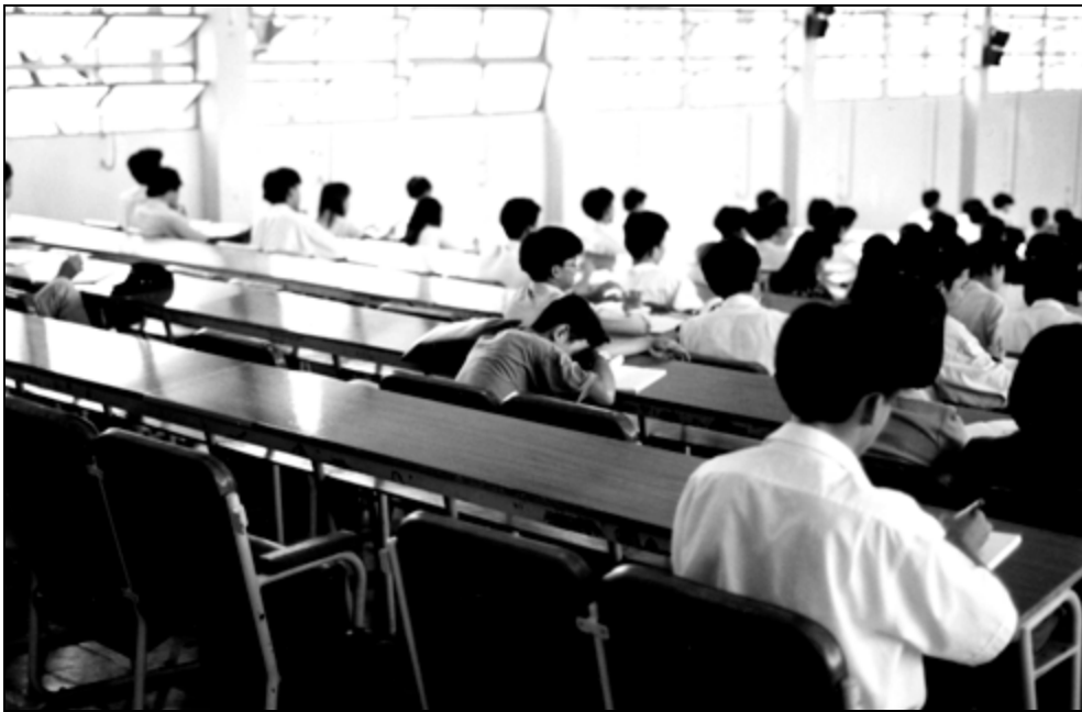
Lehrvorträge fressen Energie – auch anderswo.