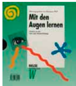
Hermann Will (Hrsg.) (1994, 2. Aufl.) Mit den Augen lernen: Medien in der Aus- und Weiterbildung (5 Bände: Lernen mit Bildmedien, Lerntexte & TN-Unterlagen, Pinwand, Flipchart & Tafel, OHP & Folien, Lernen mit Video & Film). Beltz Verlag. vergriffen